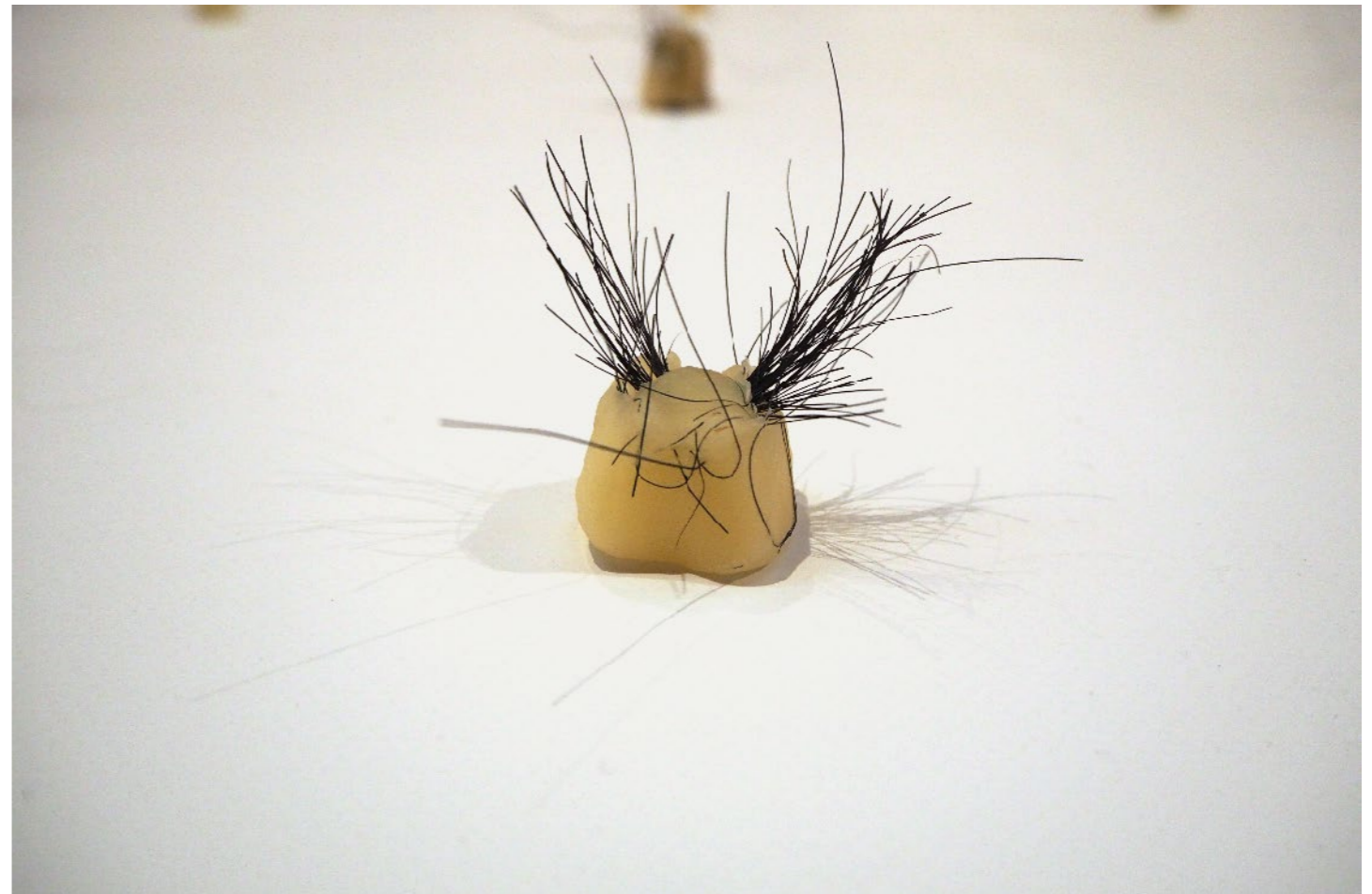
5 cm x 4 cm