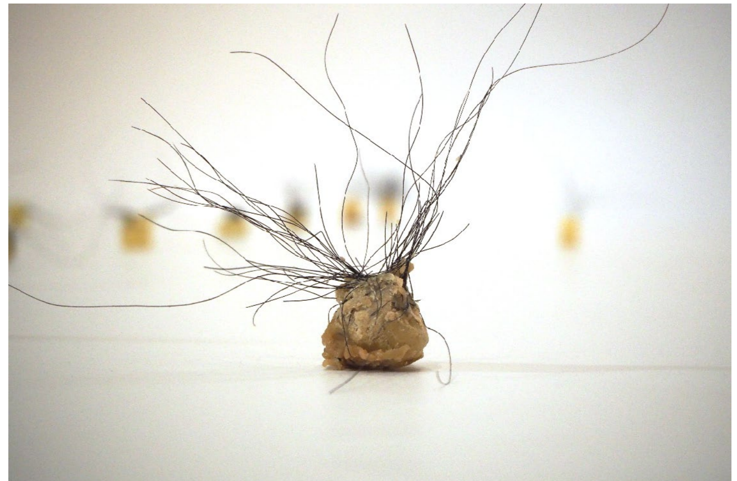
12 cm x 12 cm