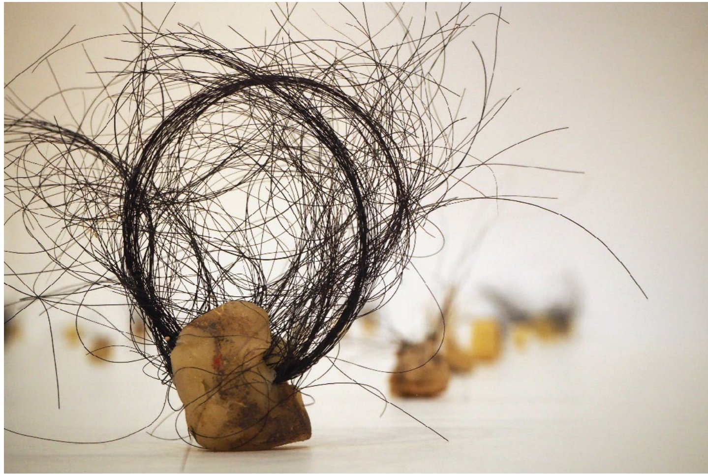
12 cm x 12 cm