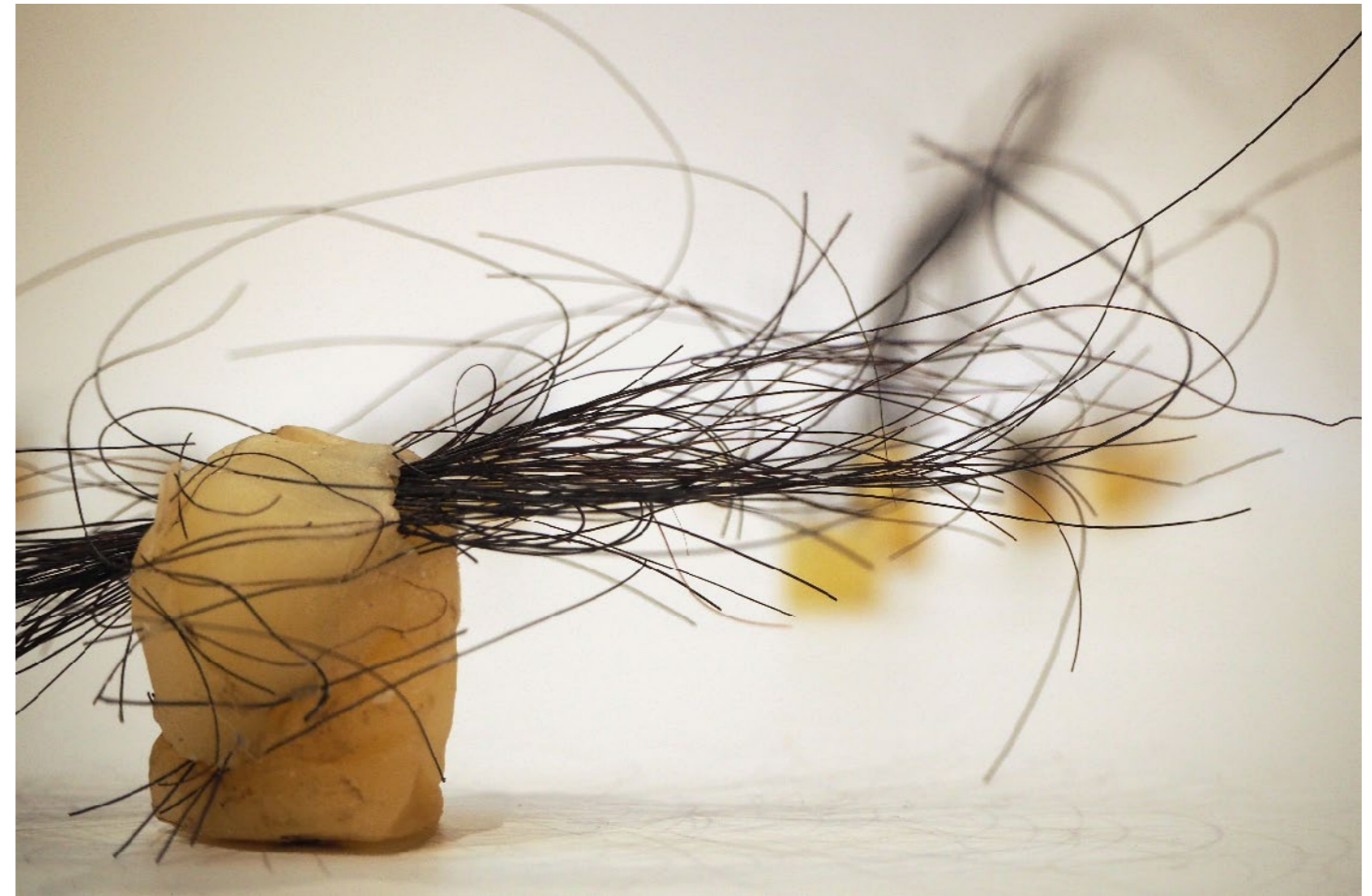
6 cm x 12 cm