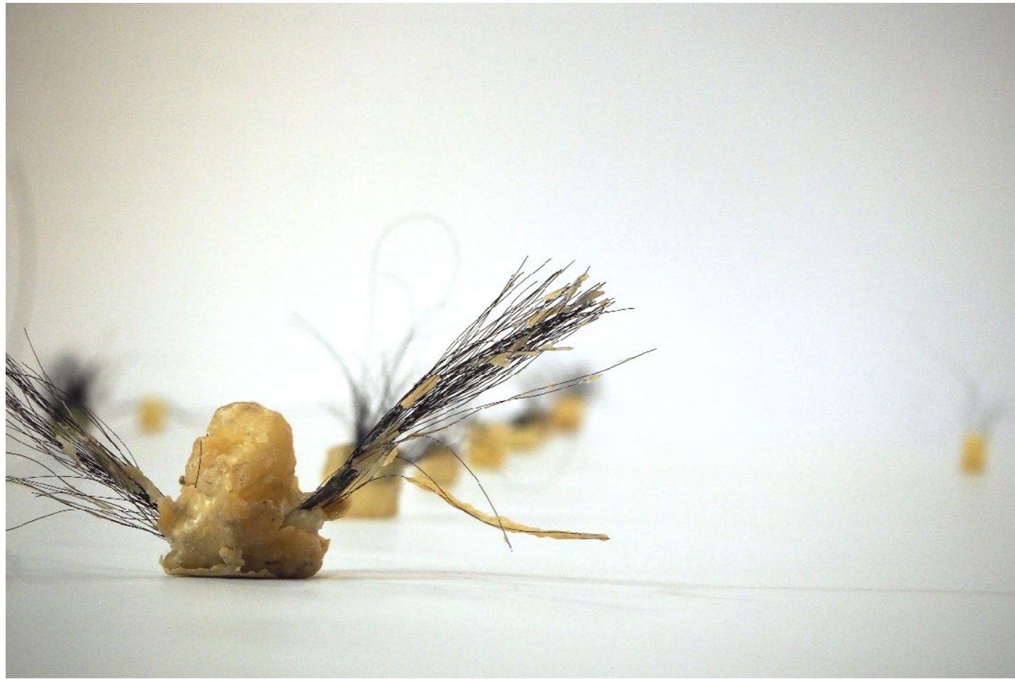
6 cm x 12 cm