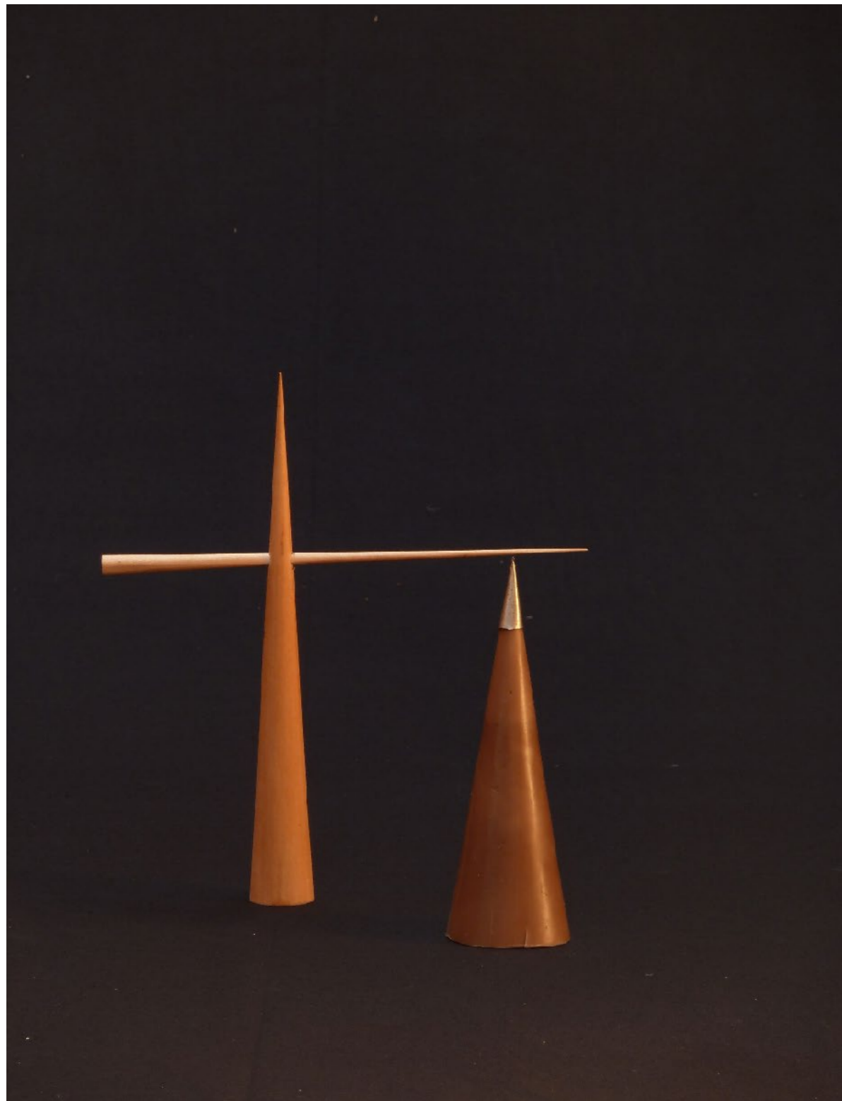
Cône Bois vertical 0,30 m x 0,035 m Cône Bois horizontal 0,27 m x 0,012 m Cône Cire – Pointe métal 0,21 m x 0,060 m 2001

Formes coniques posées au sol trouvent leur verticalité.