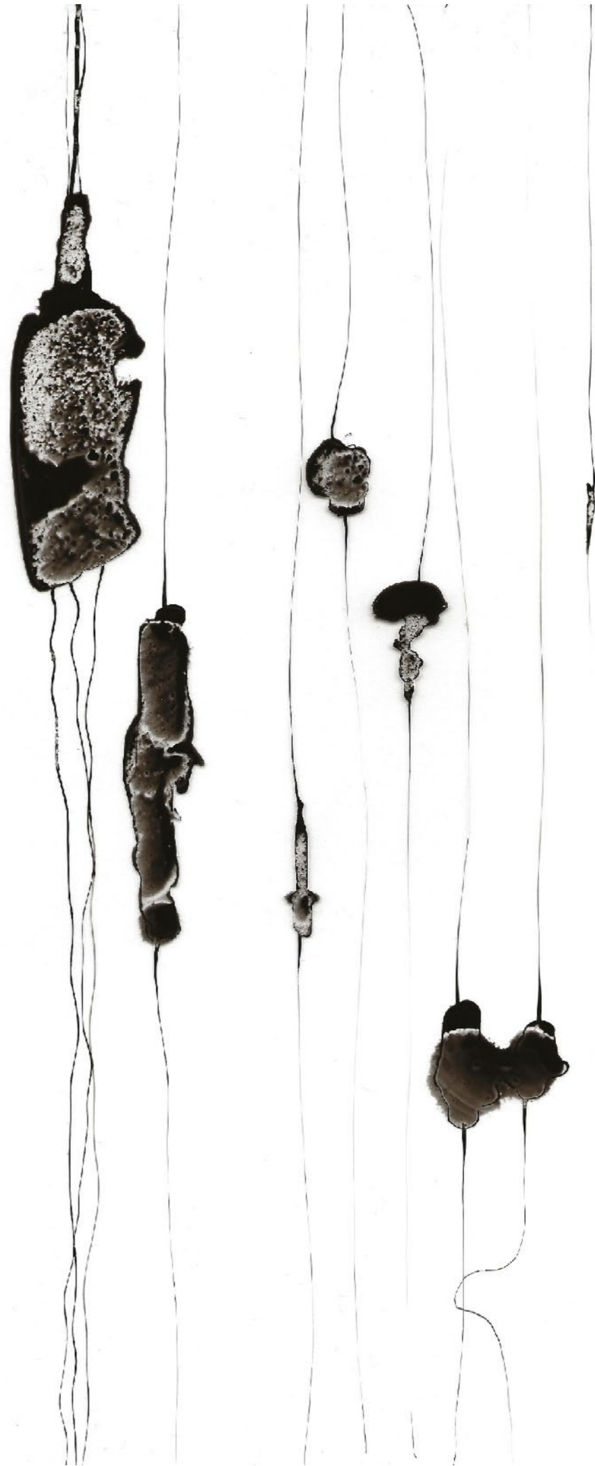
Encre de chine sur translucide 0,21 m x 0,297 m 2018