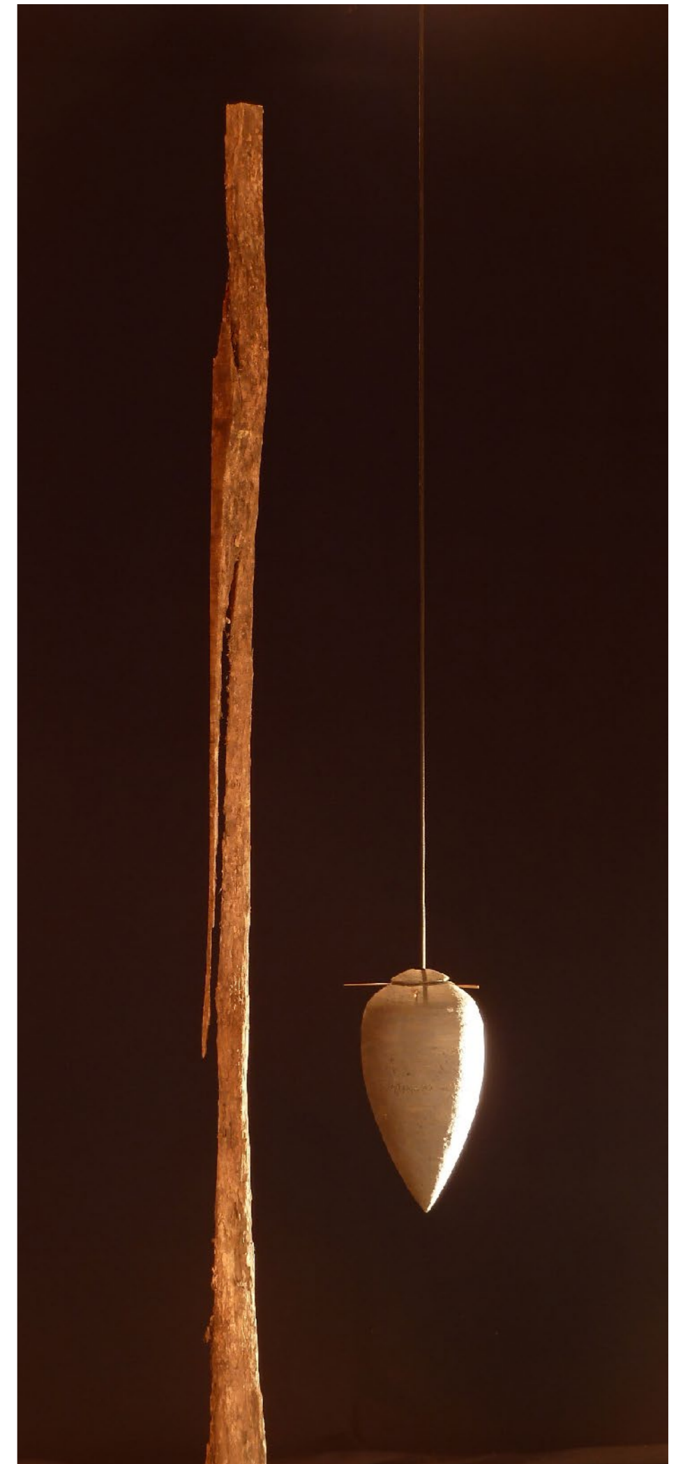
Bois 2,57 m x 0,08 m Terre 0,40 m x 0,18 m + corde et tige de fer 2001

Vidéo consultable à l'adresse suivante : https://vimeo.com/312136263